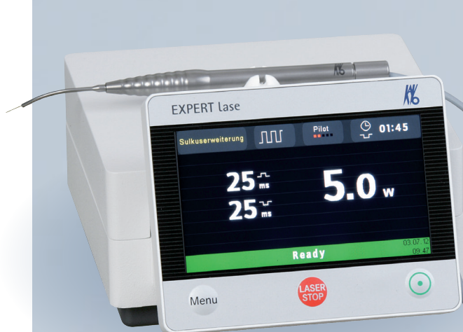
KaVo Expert Series