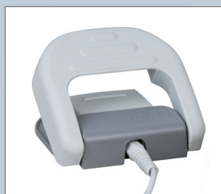
Stopalka KaVo EXPERT lase

KaVo MASTER lase in KaVo EXPERT lase predstavljata eno izmed najudobnejših in najbolj sodobnih metod za najmanj invazivne posege. Ob tem vas bosta prepričala tudi z izjemno varčnostjo in s KaVovim zanesljivim servisom. Diodni laserji KaVo so tako izjemno privlačna rešitev za vas in za vaše paciente.