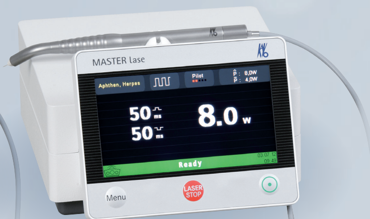
KaVo Master Series